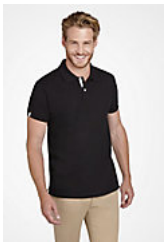
SOL'S PORTLAND MEN 00574